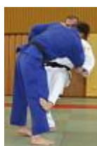
Hiza-Guruma ili Sasae-Tsuri-Komi-Ashi